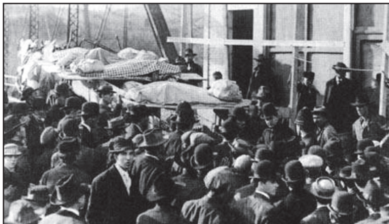
I primi corpi recuperati dalla miniera di Monongah

marmo grezzo, raffigurante una donna minuta, ma dall'espressione forte e determinata.