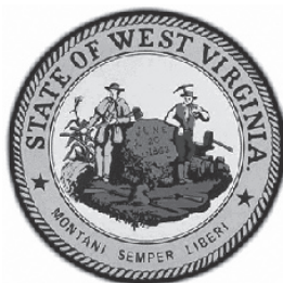
Lo stemma del West Virginia

Un tempo l'epiteto " Minonga, Mironga " (Monongah - distorto forse dalla lingua utilizzata dagli emigrati), nel dialetto del nostro paese, rievocava un luogo lontano e pericoloso, ma anche tragiche sparizioni, fughe, fallimenti. Era uno di quei detti locali di cui non si conosceva bene il significato, a volte utilizzato per offendere, per indicare una jattura o peggio per bestemmia: " Chi vo jre a Mironga! ", " Te piensi ca vaju a Mironga? ".