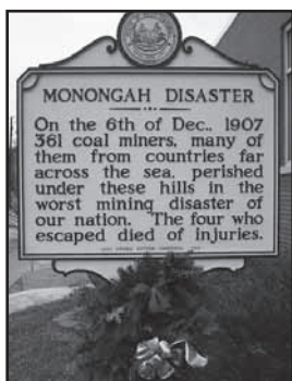
Monongah. Targa commemorativa del disastro minerario

Tuttavia di questa tragedia non ne parlò per lungo tempo nessuno. Eppure una sciagura che fotografa tutta la storia di San Giovanni in Fiore, fatta di povertà e di emigrazione continua, di coraggio e di paure, di stenti e di speranze. Nell’umile fardello di quegli uomini e di quelle donne, che affrontavano il lungo viaggio oltreoceano per raggiungere l’America, vi erano poche e semplici cose, ma un bagaglio di valori e principi autentici di una civiltà contadina che basava la propria cultura sul rispetto, sul sacrificio, sulla solidarietà e sul lavoro. Oggi a quanti, costretti ad abbandonare il proprio paese, va riconosciuto l’alto merito di aver contribuito al riscatto della propria terra d’origine dalla miseria, nonché al progresso delle comunità d’accoglienza, attraverso il lavoro duro, a volte umiliante, ma di certo un lavoro svolto con dignità e dedizione, con la caparbieta tipica dei sangioannesesi; lavoro che ha consentito spesso di raggiungere obiettivi di prestigio, di alta professionalità e di successo in tutti i settori. Lavoro e impegno a volte ingrato, costato spesso il sacrificio della propria vita.