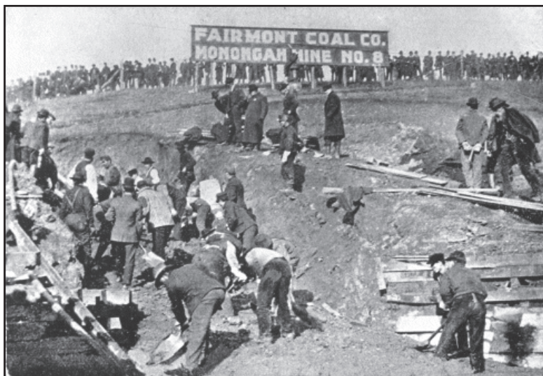
Monongah. Lavori di sgombrò intorno alla miniera numero 8 (archivio WVLU)

M onongah era un piccolo sobborgo che sorgeva nei pressi di una miniera, ubicato a quasi 300 metri di altitudine nello Stato del West Virginia (USA). Il nome Monongah , che secondo alcuni trae la sua origine dal dialetto indigeno, significa “lupo” e (forse solo per puro caso) il paesaggio intorno a Monongah ricorda in un certo qual modo la nostra bella Sila,