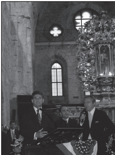
Abbazia fiorentina. Il Governatore del West Virginia Joe Manchin III a San Giovanni in Fiore

da Monongah che oggi ospita diverse famiglie discendenti dai primi emigrati, e proprio in quell'occasione il governatore del West Virginia Joe Manchin III su invito delle istituzioni regionali ha visitato la Calabria per firmare un Patto d'Amicizia e ricevere a San Giovanni in Fiore la cittadinanza onoraria del paese dal quale i suoi antenati un secolo prima erano emigrati. Perché l'emigrazione italiana non è soltanto una storia dolorosa di vittime, discriminazioni e sfruttamento, ma è anche l'odierna realtà di milioni di italiani nel mondo e dei loro discendenti, perfettamente in-