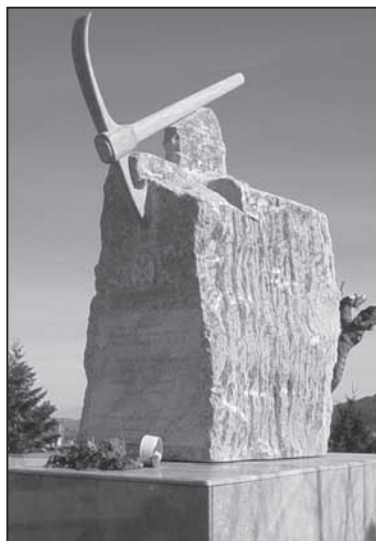
San Giovanni in Fiore. La stele che ricorda i caduti di Monongah