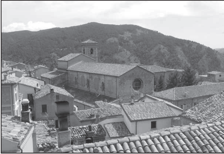
San Giovanni in Fiore. Abbazia Florense

ritori rinvennero sei corpi di minatori ancora gravemente feriti; i cinque che riuscirono a salvarsi, di cui tre italiani, riferirono di un gran numero di uomini al loro seguito in preda al panico, alla ricerca dell'uscita da quell'inferno. Le speranze di riuscire a trarre in salvo qualche superstite risultarono vane sin da subito e immediatamente si intuì tutta la difficoltà nell'identificazione di corpi dilaniati.