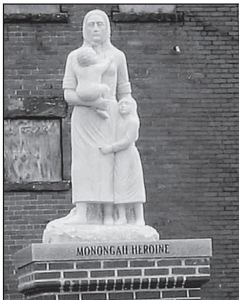
Monumento fatto erigere a Monongah dal Consiglio regionale della Calabria.

Ad agosto del 2007 il Consiglio Regionale calabrese ha fatto erigere a Monongah, per la ricorrenza del centenario del più grave incidente minerario della storia americana, una scultura in