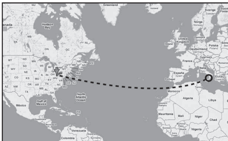
San Giovanni in Fiore - Monongah. Il tragitto dei nostri emigrati per raggiungere l'America

gah non deve essere, però, solo motivo di commemorazione, ma deve rappresentare l'impegno da parte di tutti noi nella costruzione di una consapevole cittadinanza e di una cultura della sicurezza che possa consentire di evitare il ripetersi di simili tragedie sui luoghi di lavoro. Soprattutto oggi che l'Italia è diventata terra di approdo e di speranza di tanta gente che proviene dai Paesi più poveri del mondo e che, oggi come allora, cerca migliori condizioni di vita. La rievocazione della tragedia di Monongah deve servire, soprattutto alle giovani generazioni, per riflettere sul fenomeno "emigrazione" e per riconoscere pari dignità e diritti a chi, come è successo a tanti nostri emigrati, lascia la propria terra e la propria famiglia per costruire un futuro migliore.