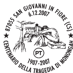
Annullo speciale filatelico realizzato in occasione del centenario