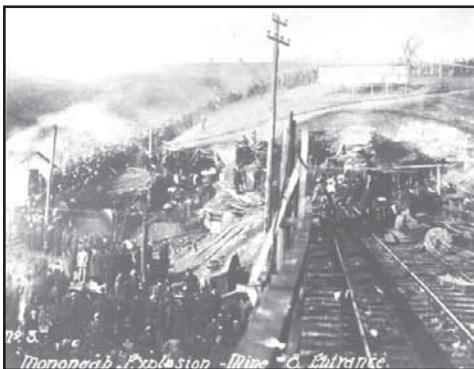
Monongah. Ingresso alla miniera n. 8

I minatori e le loro famiglie abitavano in baracche, di proprietà della stessa compagnia mineraria, spesso fatiscenti e prive degli indispensabili servizi igienici. Lavoravano anche più di dieci ore al giorno nella polvere, ed erano retribuiti sulla base delle quantità di carbone estratte dal giacimento: nel migliore dei casi riuscivano a percepire 0.75 dollari al giorno, circa 3.75 lire, paga nettamente superiore a quella che percepiva un bracciante agricolo nella Calabria dei primi del '900. I nostri emigrati erano consapevoli dei pericoli cui si andava incontro lavorando in miniera, ma erano pronti a correre il rischio con la speranza di mettere da parte abbastanza denaro da investire in un impiego diverso, magari meno rischioso, oppure con il sogno di ritornare nei paesi d'origine. Il 5 dicembre del 1907 a Monongah era