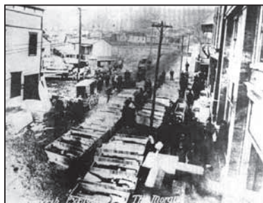
L'obitorio allestito in strada il 12 dicembre 1907